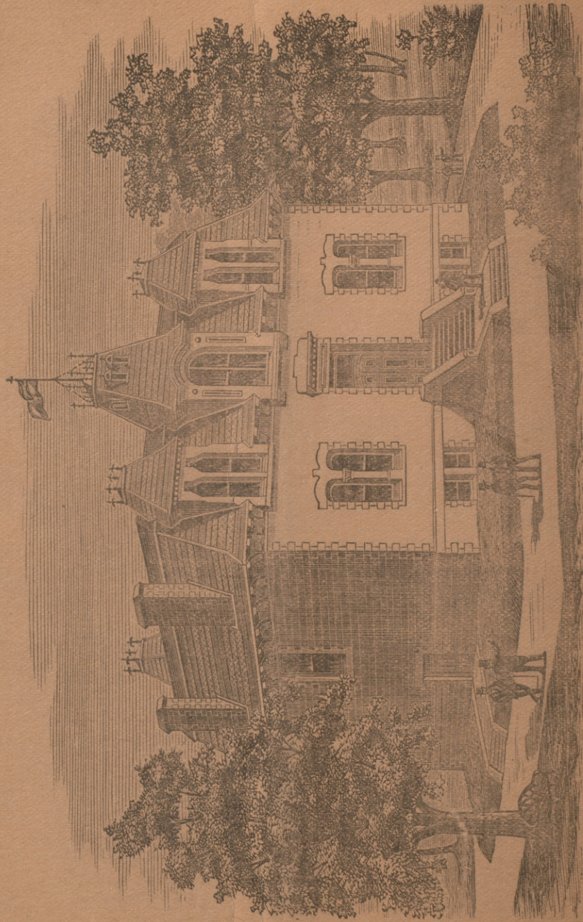
ECOLE DE MEDECINE ET DE CHIRURGIE DE MONTREAL, VIS-A-VIS L'HOTEL-DIEU, MONTREAL.