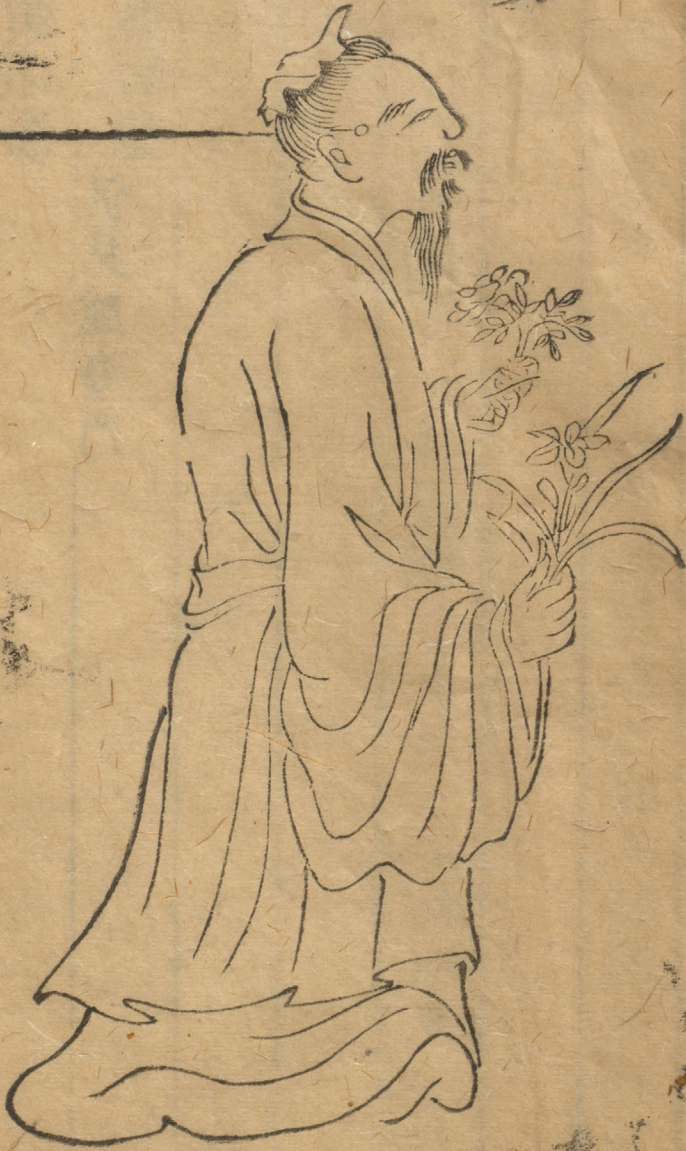
圖 痘 瘡