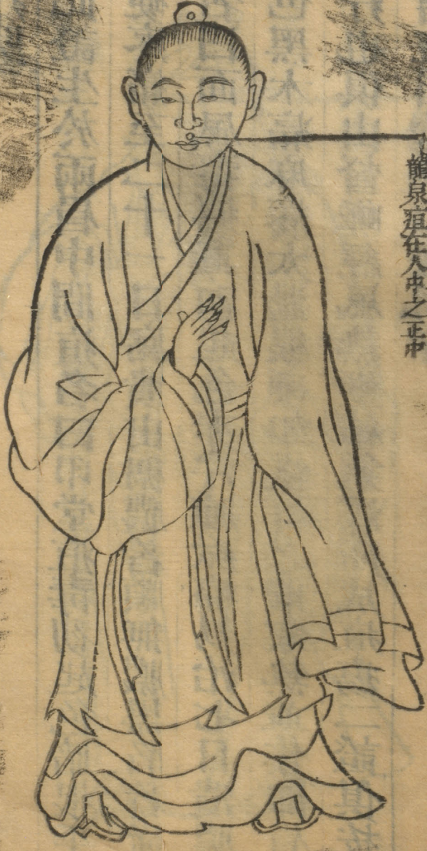
龍泉疽在入中之正