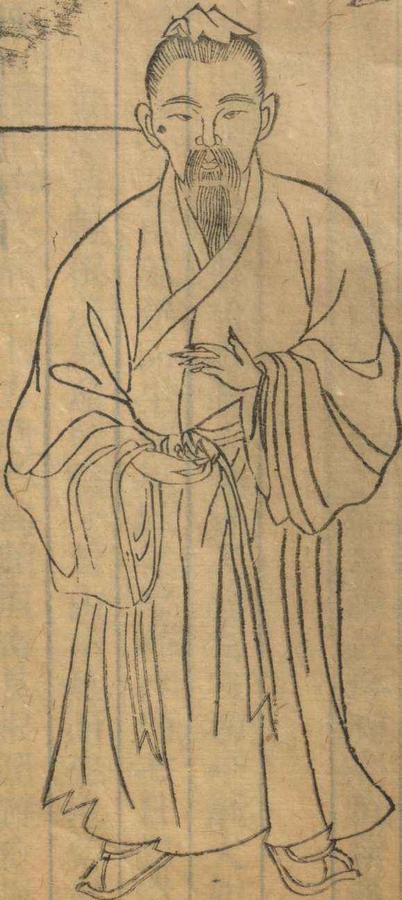
圖 疔 額