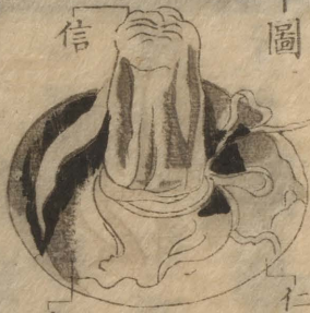
仁 ニ 圖