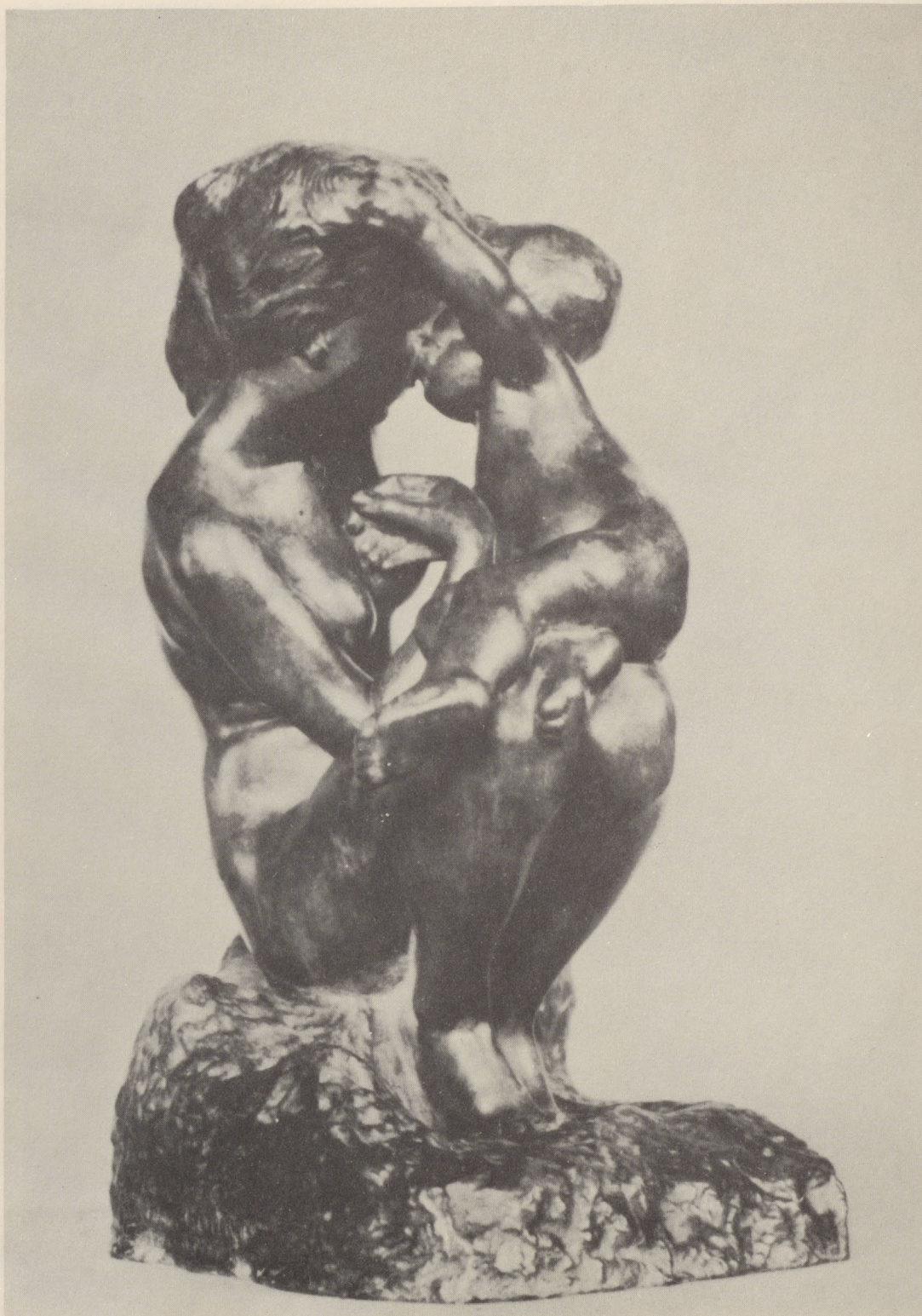
LA JEUNE MERE ABOUT $9,250- 15 1/4" (1885) Bronze (EXCL. BASE)