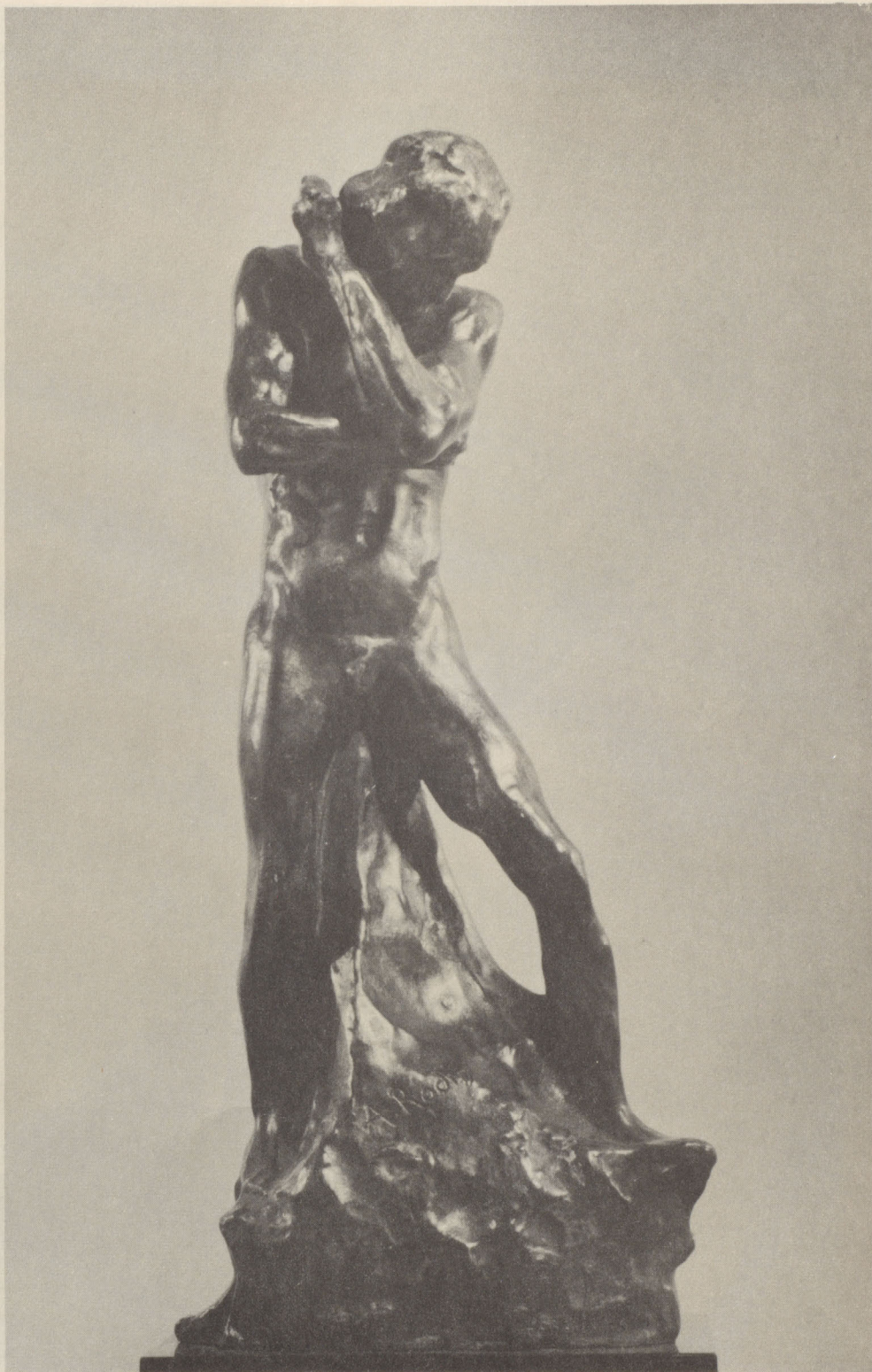
PETITE OMBRE $2,250- Bronze, 12½ inches