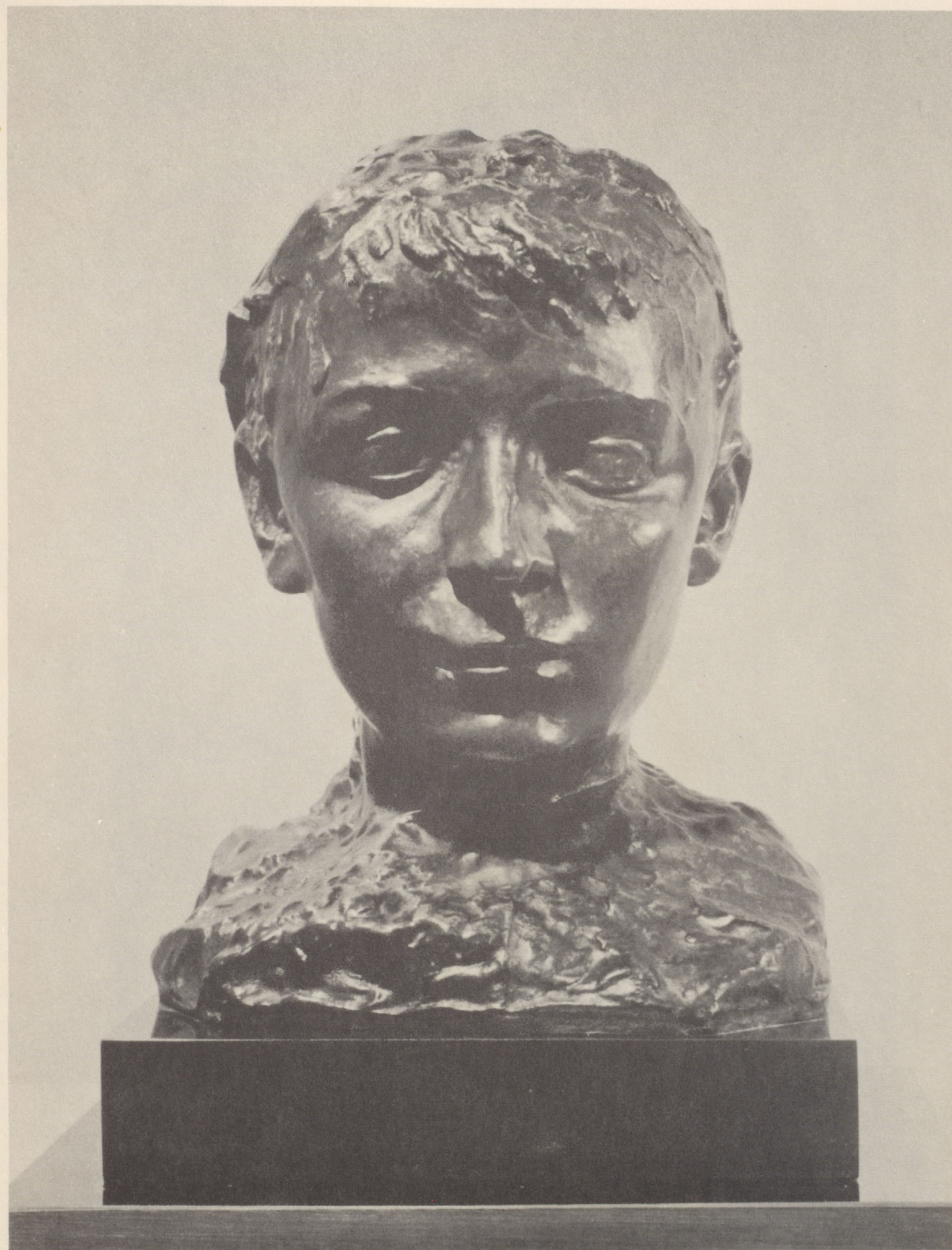
CAMILLE CLAUDEL SOLD Bronze, 10 \frac{3}{4} inches