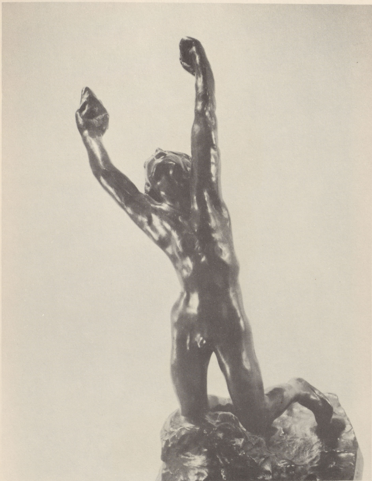
L'ENFANT PRODIGE 76,400- Bronze, 22 inches