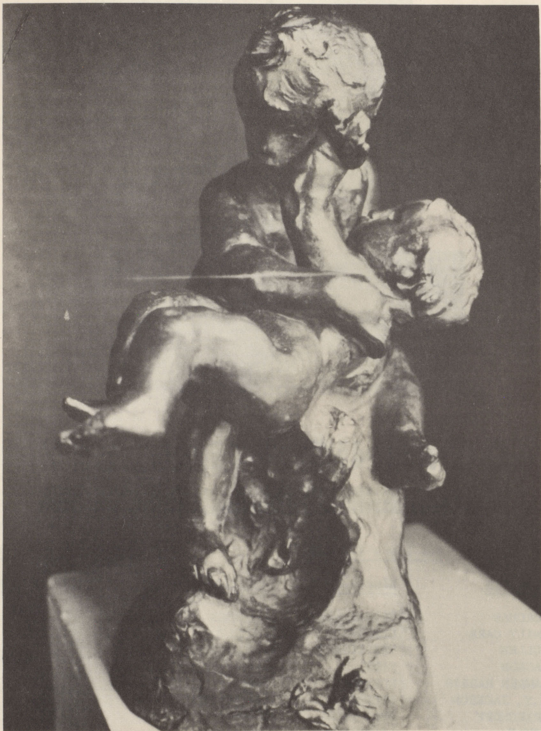
ENFANTS AU LEZARD ABOUT $11,000 - Bronze (1885) 15 1/4" (EXCL. BASE)