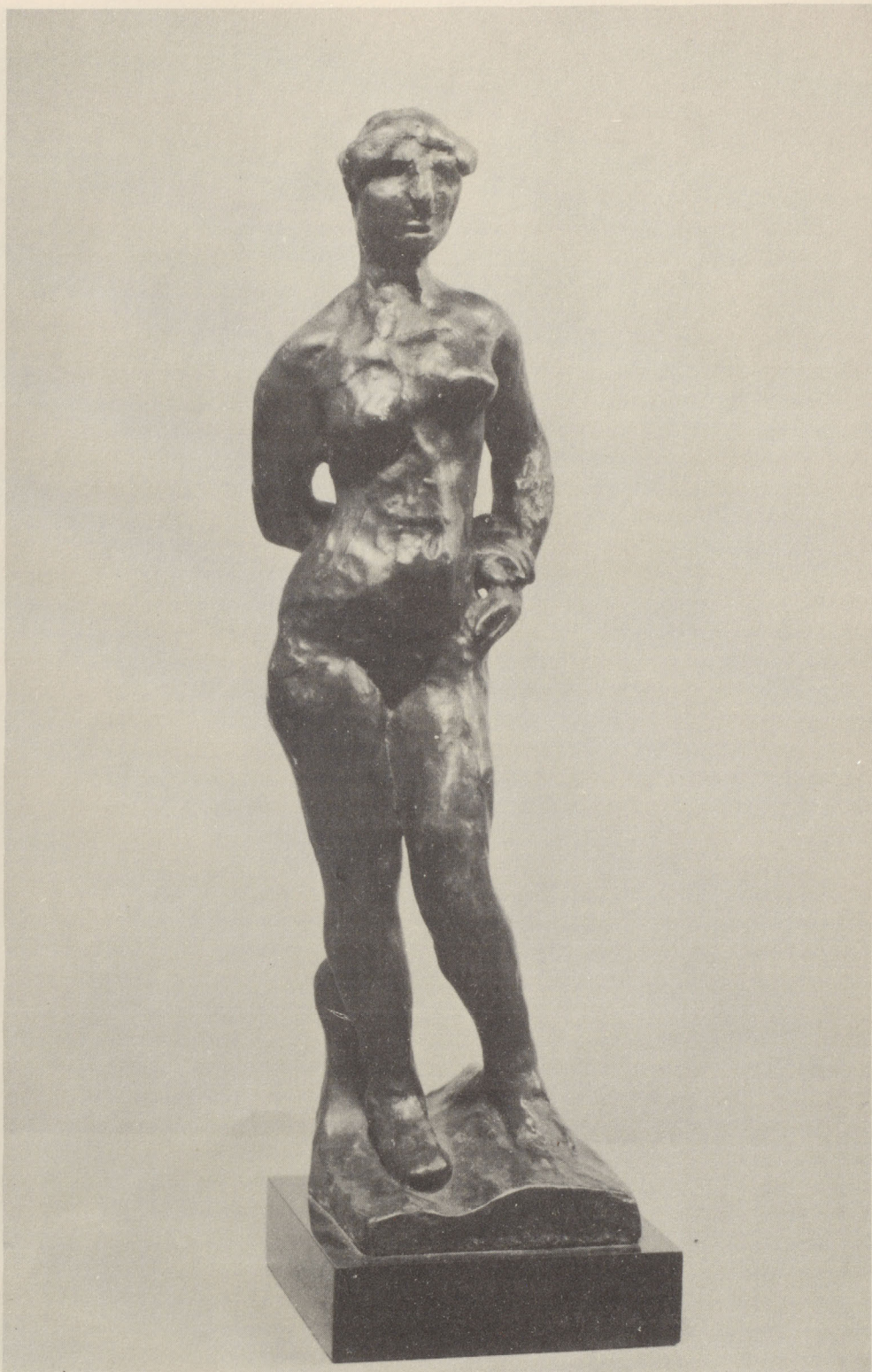
PSYCHE $2,400- Bronze, 14 \frac{1}{4} inches