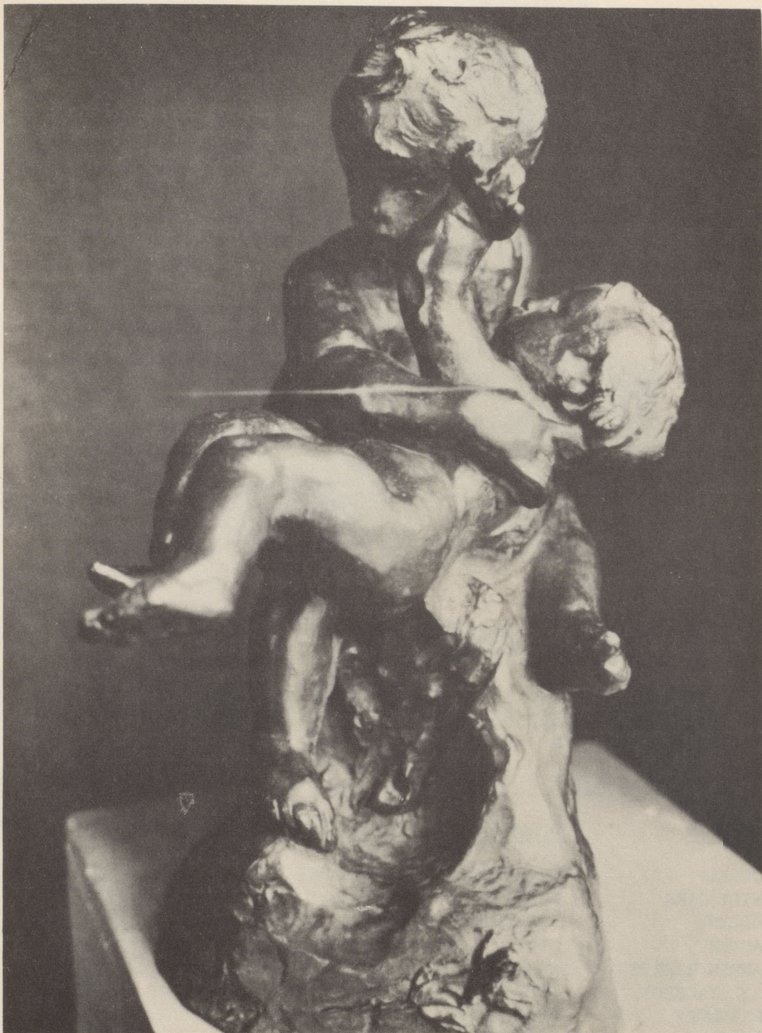
ENFANTS AU LEZARD 1885 15 \frac{1}{4} " EXCLUDING BASE Bronze