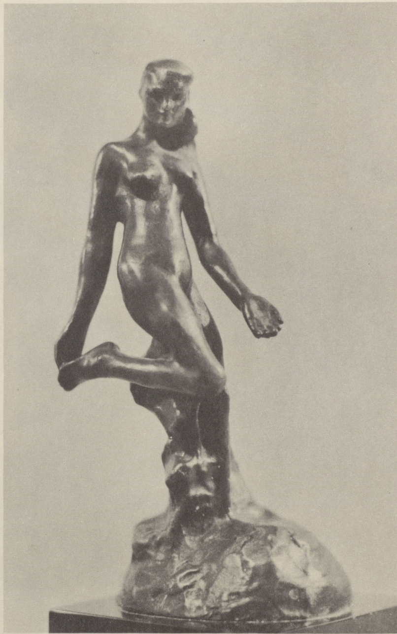
ETERNELLE IDOLE SOLD Bronze, 7 inches