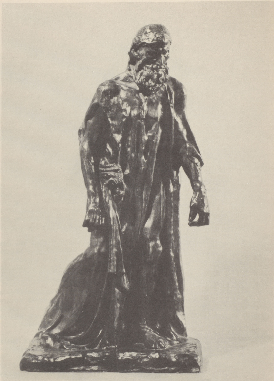
EUSTACHE DE ST-PIERRE