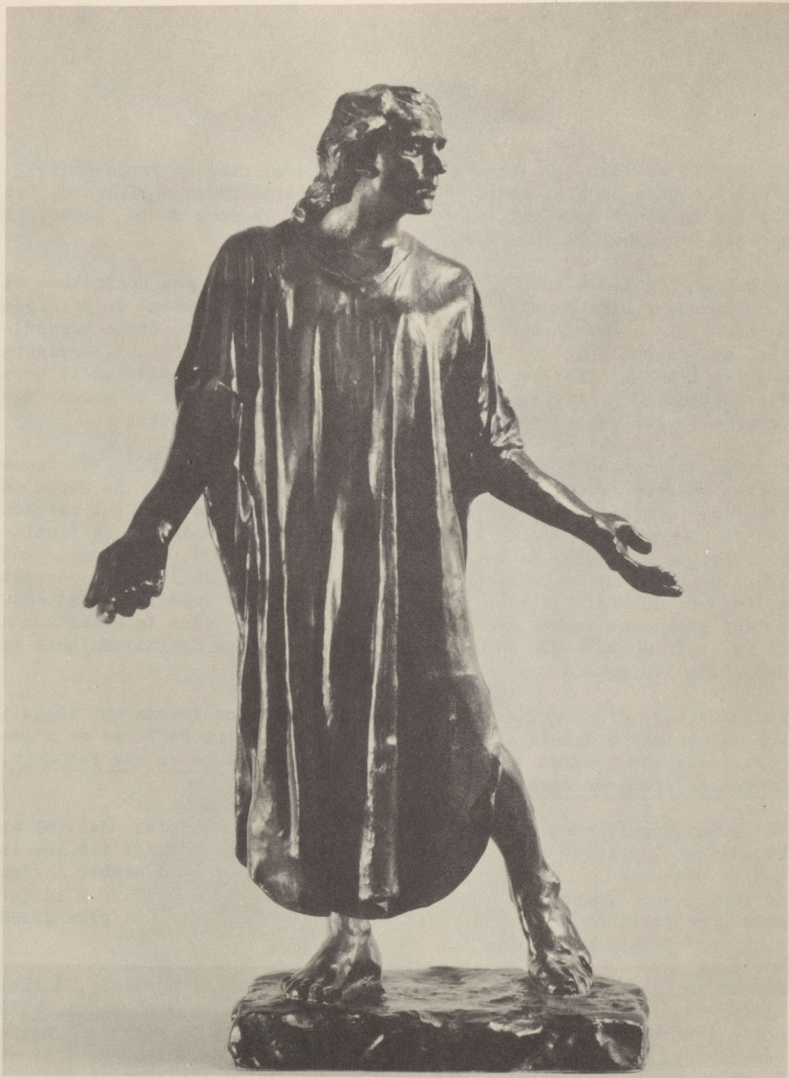
JEAN DE FIENNES #6,500.- Bronze, 18 \frac{1}{4} inches