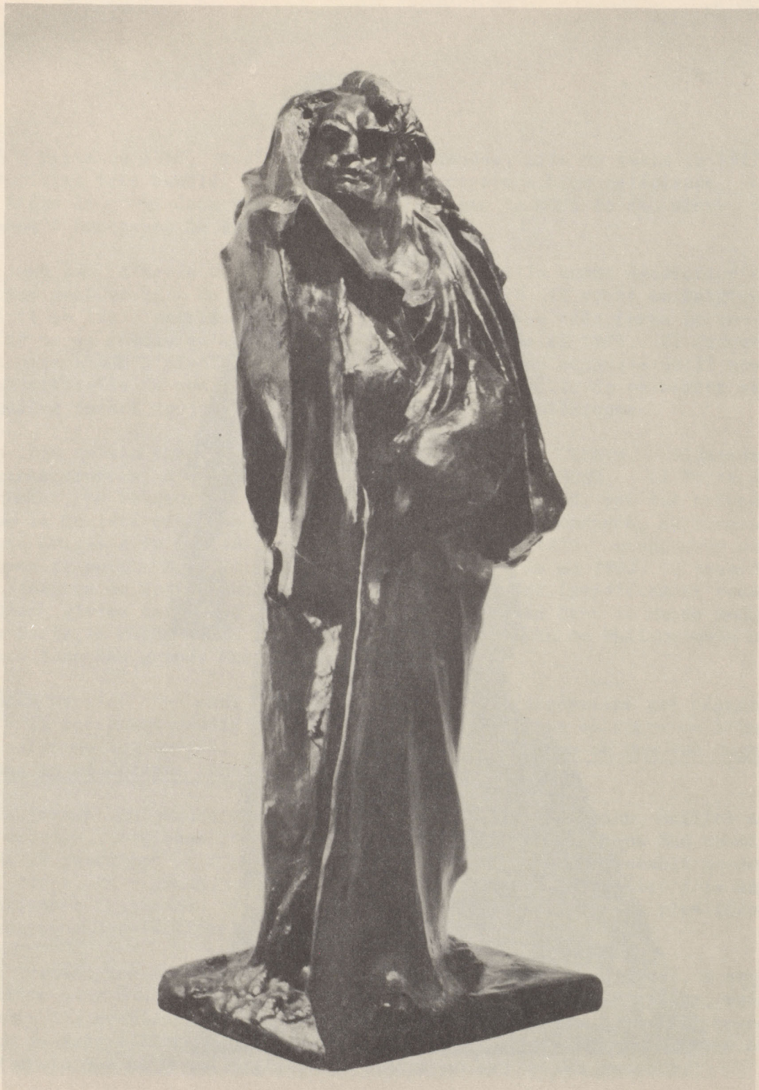
BALZAC # 21 000.- Bronze, 42 inches